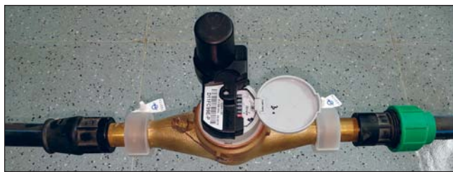
VODOMĚR s instalovaným vysílačem.

K získání náhledu na aktuální data o spotřebě vody musí mít odběratel zřízen přístup na zákaznický účet prostřednictvím internetu. Pro zaslání upozornění na odchylky od standardní spotřeby musí vyplnit k tomu určený formulář „Žádost o aktivaci upozornění – spotřeba vody“. Více informací, včetně příslušného formuláře, naleznete na webových stránkách www.ovak.cz .